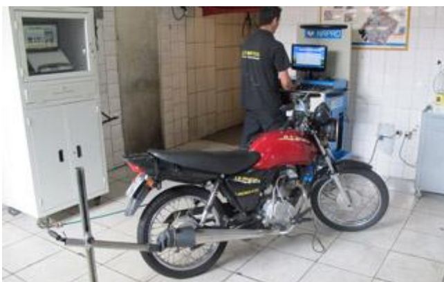
Analisador de gases avalia alterações nas emissões de gases e ruídos

Por falar em quilometragem, atenção com as motos 'pouco rodadas'. Apesar do que aparece no hodômetro, elas podem revelar a idade avançada em outros pontos, como pedaleira gasta. "Uma moto com 5.000 km, por exemplo, não pode ter este componente desgastado. Quando abaixar para ver as pedaleiras, aproveite para ver se não estão raladas, sinal de tombo", indica Itamar.